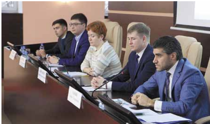
Публичные обсуждения правоприменительной практики Московского УФАС России совместно с ФАС России

7 декабря 2018 г. в Москве прошли публичные обсуждения правоприменительной практики Московского УФАС России совместно с ФАС России . Представители столичного и федераль-