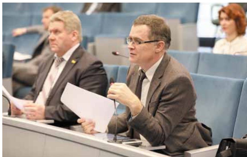
Обсуждения и дискуссии – особенность работы Общественного совета при ФАС России

По информации Управления общественных связей ФАС России