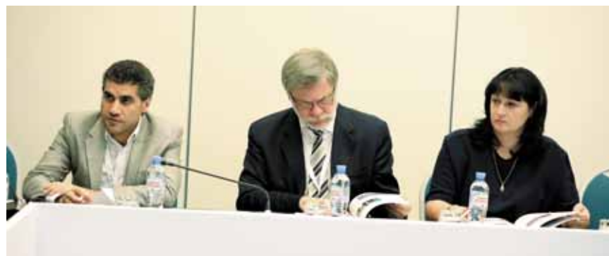
Редакционный совет журнала знакомится с номером, подготовленным к «Неделе конкуренции»

ционального плана развития конкуренции, нормативных документов, принимаемых в его исполнение, события, происходящие в рамках реализации Национального плана. Например, после утверждения Правительством