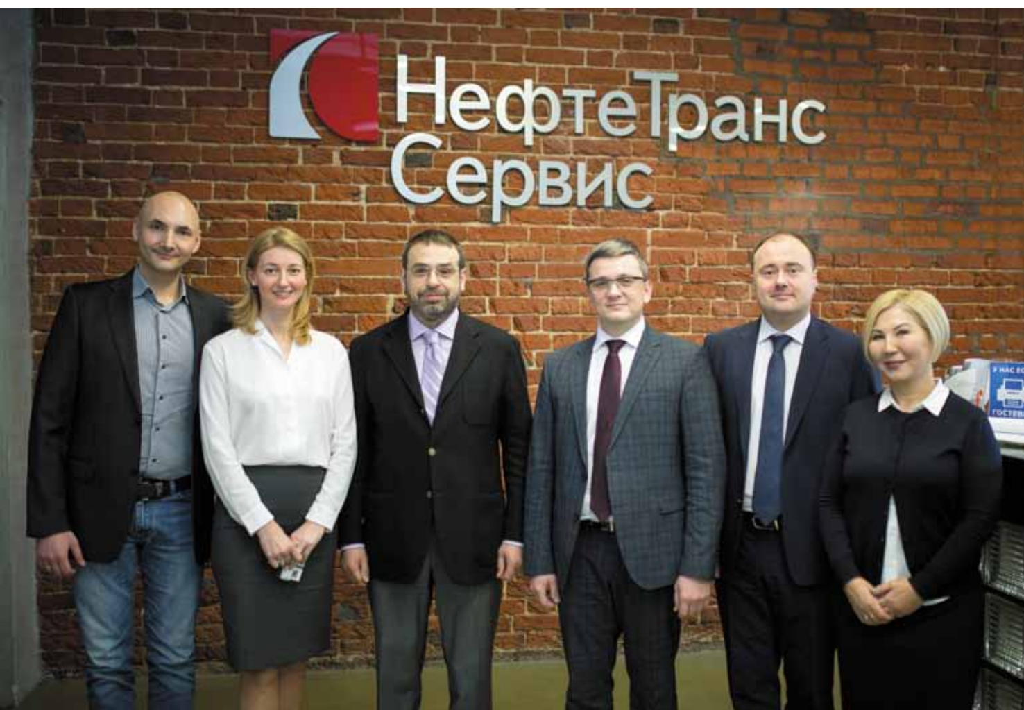
Преподаватели и участники семинара «Антимонопольный комплаенс: практика внедрения и эффективность применения»

Филиал УМЦ ФАС России (г. Москва) провёл практический семинар для компании «НефтеТрансСервис»