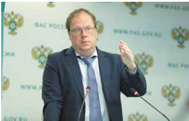
Первый заместитель секретаря Общественной палаты Российской Федерации В. Гриб