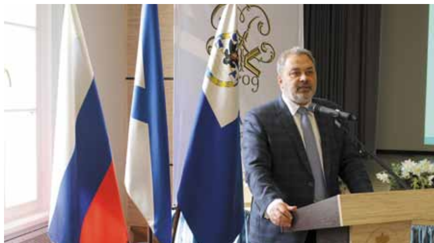
Публичные обсуждения Санкт-Петербургского УФАС России

бличных обсуждений и открытости деятельности государственных органов в рамках реформы контрольно-надзорной деятельности. Одновременно велась онлайн-трансляция мероприятия на YouTube-канале Управления.