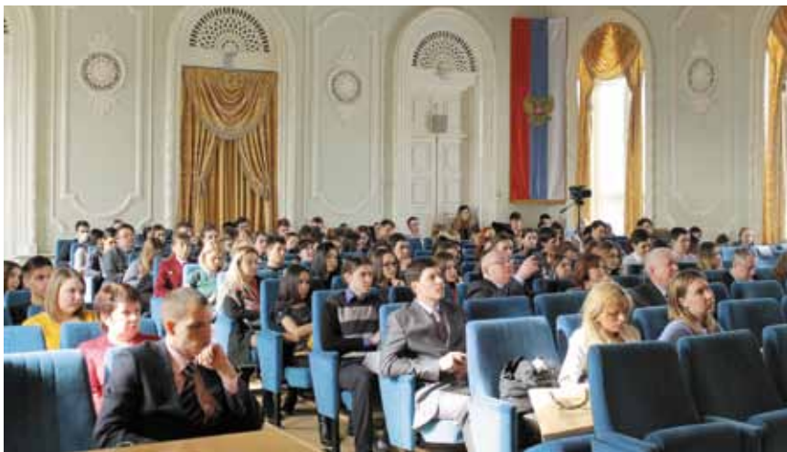
Участники публичных обсуждений Башкортостанского УФАС России