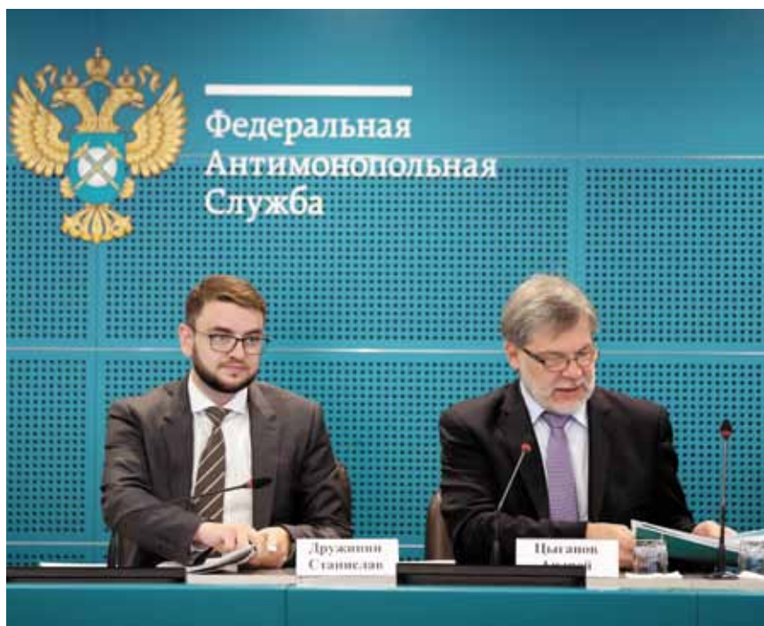
Открытие конференции «Антимонопольный комплаенс в России: о главном в преддверии появления нового института» 19 июня 2018 г.

Приоритетные направления работы в 2019 году закономерно связаны с сопровождением исполнения Национального плана развития конкуренции в части, касающейся повышения компетенций представителей хозяйствующих субъектов и органов власти в сфере антимонопольного законодательства, адвокатирования конкуренции, организации научно-образовательных и просветительских мероприятий, издательской деятельностью. Обо всех предстоящих мероприятиях, возможностях филиала УМЦ ФАС России (г. Москва) традиционно можно узнать на страницах нашего журнала «Конкуренция сегодня».