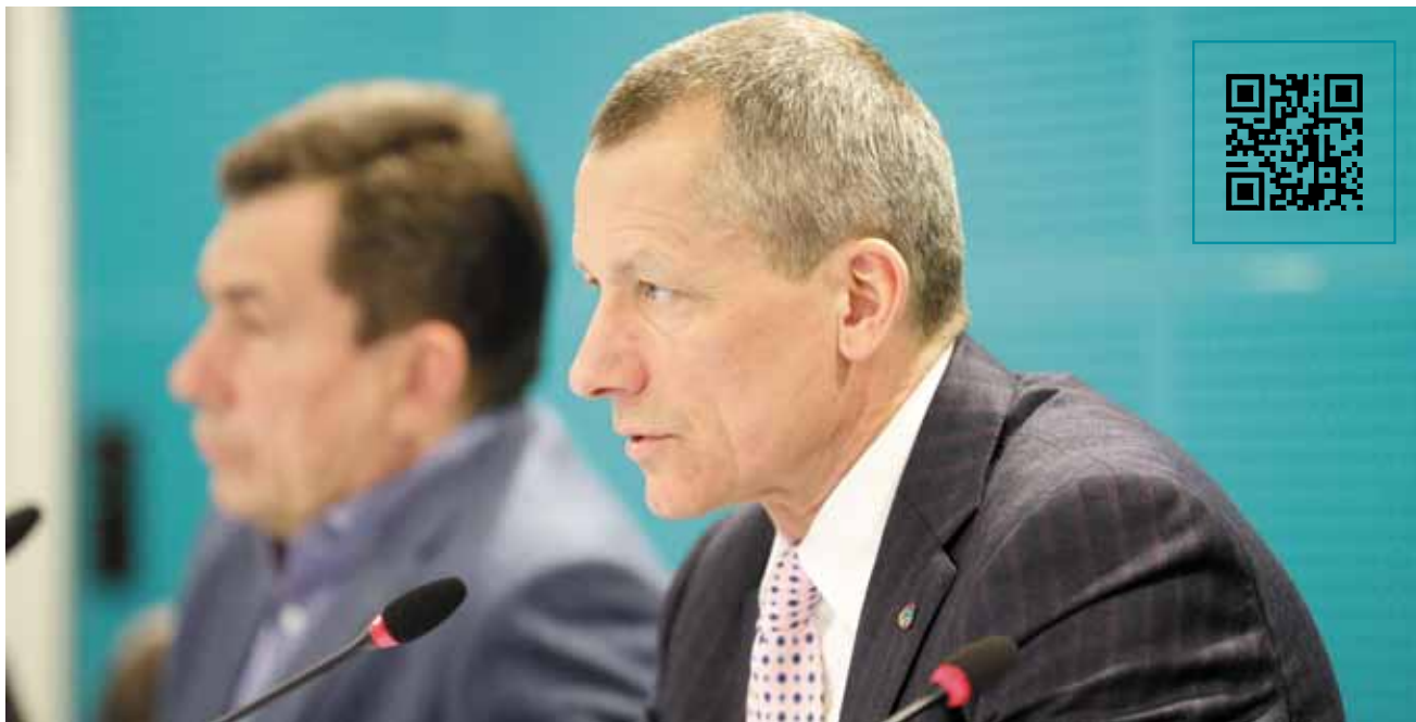
Заседание ведёт председатель Общественного совета при ФАС России Андрей Шаронов

проекта позволит унифицировать этот процесс. Документ устанавливает исчерпывающий перечень сфер и видов регулирования цен, создание которого закреплено Указом Президента России №618, а также единые для всех регулируемых сфер методы формирования тарифов. В качестве приоритетного предлагается метод сравнительного анализа. Кроме того, законопроект формирует единую для всех сфер процедуру рассмотрения дел о нарушении законодательства в области госрегулирования цен и тарифов. В основу процедуры погружены принципы объективности рассмотрения, состязательности и прозрачности.