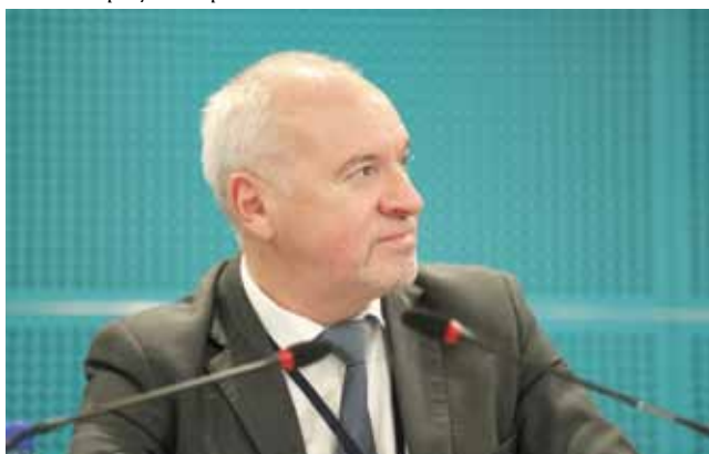
Начальник Контрольно-финансового управления ФАС России В. Мишеловин