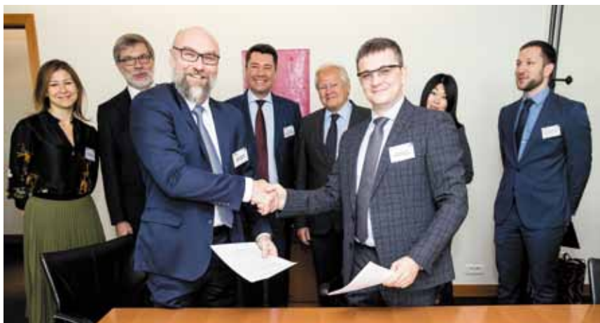
Подписание Соглашения о сотрудничестве между Учебно-методическим центром ФАС России и московским офисом Международной юридической компании Baker McKenzie

Тему антимонопольных запретов картелей и сговоров на торгах