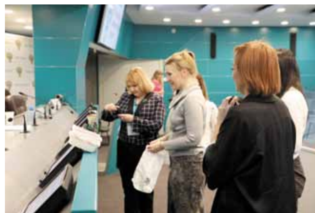
Деловая игра «Экспертный совет по НДК»