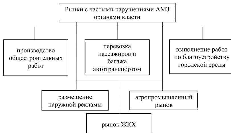
Рисунок 1 – Перечень рынков, где органы власти чаще всего нарушают антимонопольное законодательство

Но, согласно данным Министерства экономического развития, промышленной политики и торговли Оренбургской области, объем закупок у субъектов малого предпринимательства и социально ориентированных некоммерческих организаций составил в 2016 году 28,9 %, а в 2017 году уже 22,45%. Тенденция сокращения объясняется увеличением доли закупок у единственного поставщика. Следовательно, при дальнейшем увеличении количества закупок, проводимых некон-